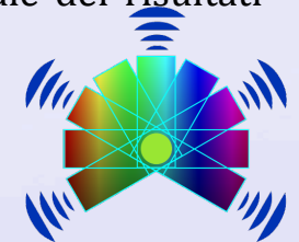
Piano Nazionale Lauree Scientifiche

La giornata sui dati non strutturati ha l’obiettivo di introdurre alcune tecniche per l’utilizzo e l’analisi di testi scaricati dal Web, in particolare sarà introdotto lo strumento di text mining, Rapidminer Studio, con il quale è possibile estrarre informazioni utili da testi, quali per esempio l’opinione degli utenti su un argomento (sentiment analysis) o gli argomenti trattati nei testi (topic extraction).